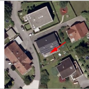
2015 - Luftbild