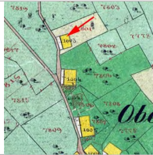
1857 - Katasterplan