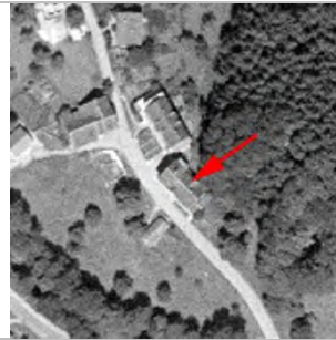
50er Jahre Vorarlberg Atlas