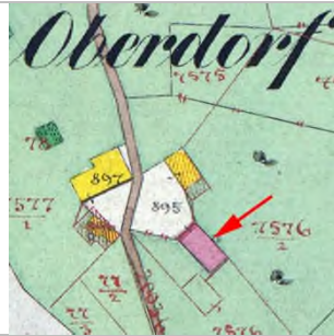
1857 Katasterplan (StAD)