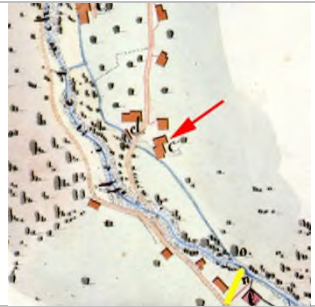
1829 Xaver Rüb (StAD)

Dornbirn Müllerstraße 15 (ehemalige Mühle) Bauparzelle 895